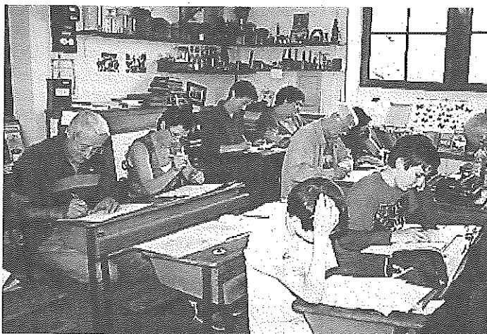
Une vraie salle de classe sera reconstituée, avec ses pupitres.

Une vraie salle de classe reconstituée vous y attendra avec ses pupitres, son estrade, le bureau du maître, des vitrines d'exposition pour petit matériel, des présentoirs pour livres, des cartes pédagogiques, etc. La communauté de communes du Réalmontais, quant à elle, vous invite à découvrir la future maison du Réalmontais et projets de centre de ressources et de médiathèque intercommunaux.